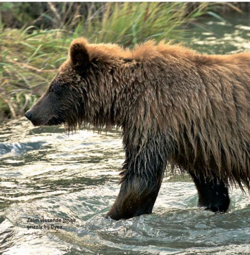
Zalm vissende jonge grizzly bij Dyea.