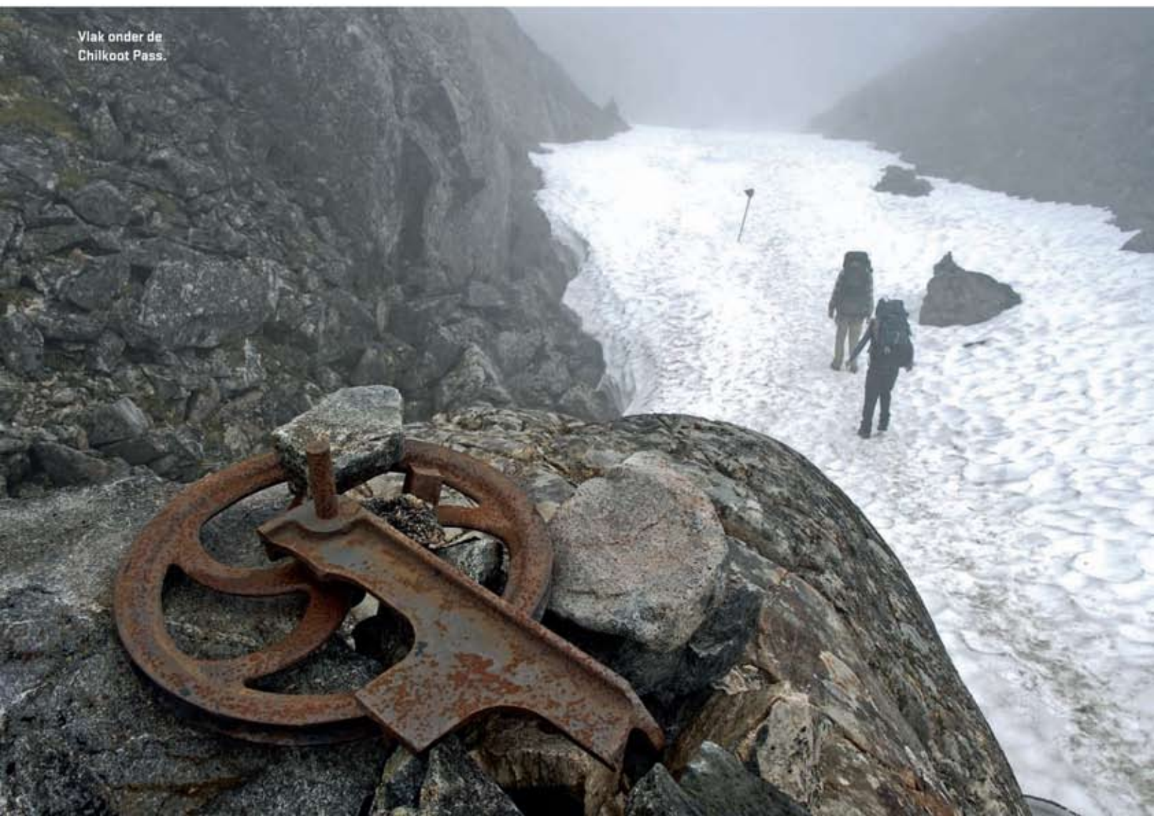
Vlak onder de Chilkoot Pass.

Bij goed weer kun je hier fraaie uitzichten verwachten, maar mist is normaal. Eigenlijk geniet ik wel van de nevel die een uur lang alleen maar méér grijze blokken lijkt te willen onthullen. Op de pas zien we roestende staalkabels en door de tand des tijds afgeknaagde planken. Het zijn restanten van een kabelbaan die vrachten voor 7,5 dollarcent per pond over de Chilkoot Pass naar Crater Lake tilde. Stampedeers die moesten leven van twee of drie dollar per dag - de meesten - konden hier alleen van dromen. De enorme stoomturbine die de paardenkrachten leverde, ligt bij Canyon City stilletjes te roesten tussen wuivende sparren.