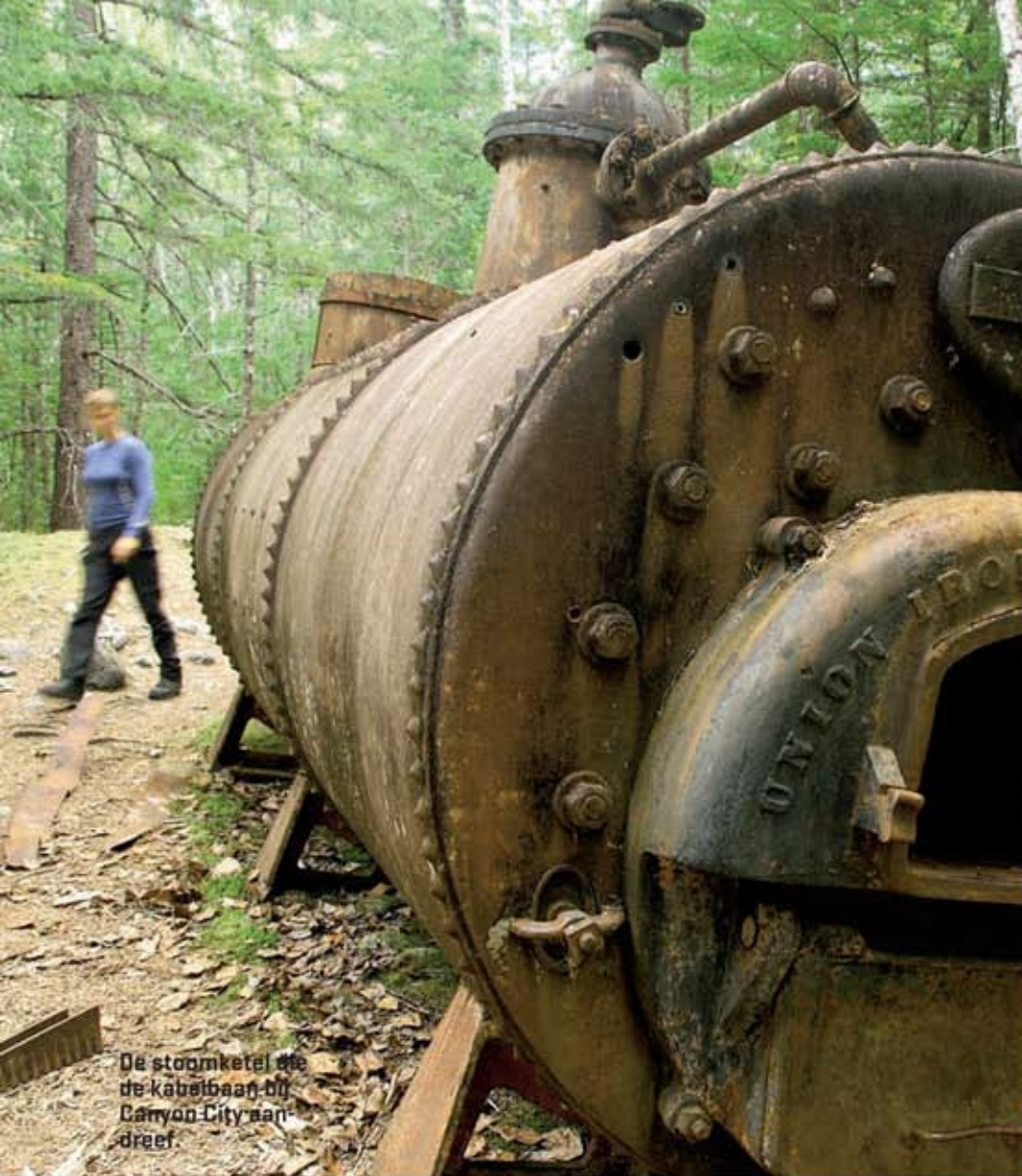
De stoomketel die de Kabelbaan bij Canyon City aandreef.