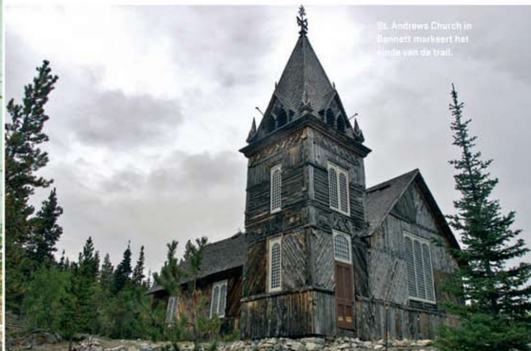
St. Andrews Church in Bennett markeert het einde van de trail.

Een grizzly, een eland, twee wolven en wellicht een veelvraat delen ons pad