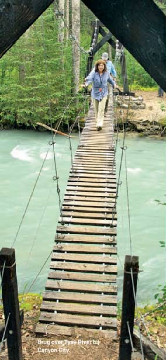
Brug over Tyey River bij Canyon City.

Een grizzly, een eland, twee wolven en wellicht een veelvraat delen ons pad