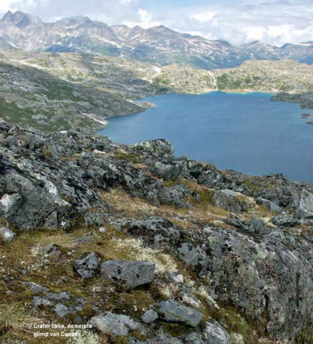
Crater Lake, de eerste glimp van Canada